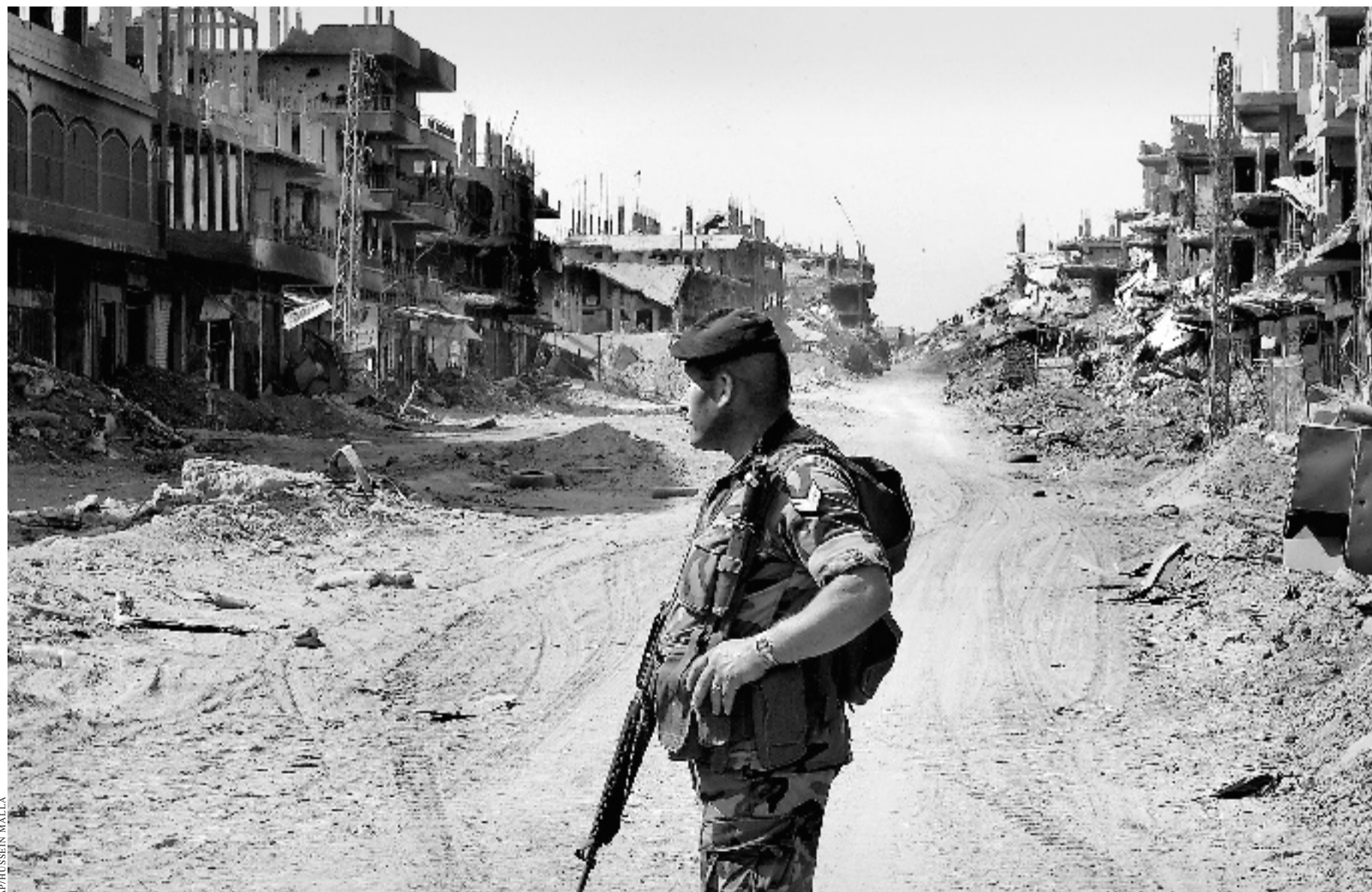
Während der Kämpfe um Nahr Al-Bared im Sommer 2007: Libanesischer Soldat im Trümmerfeld